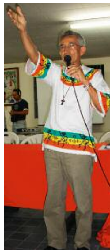
Das „Treffen gegen Intoleranz“ rüttelt die Menschen auf, sich intensiv für Randgruppen einzusetzen und sich zu solidarisieren.