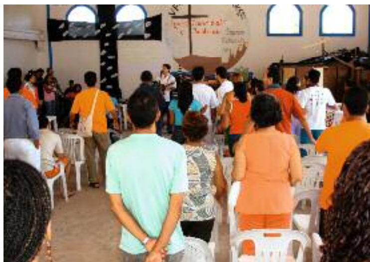
Einheit der Christen ist den Teilnehmern der verschiedenen Kirchen ein wichtiges Anliegen. Vor Pfingsten gestalten sie die Gebetswoche.

Die religiöse Unwissenheit des Volkes ist im Allgemeinen sehr