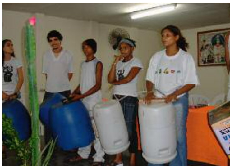
Musik und Tanz gehören natürlich zu jeder Feier dazu. Mit viel Phantasie machen sich die Jugendlichen ihre eigenen Instrumente zurecht.