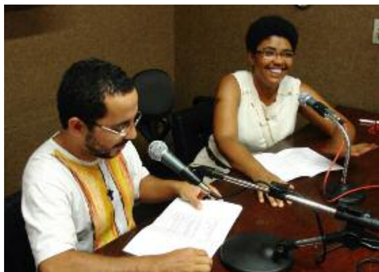
Ehrenamtliche engagieren sich, das Wort Gottes durch das Radio zu den Menschen zu bringen. Sie finden dafür kreative Wege.